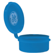
Estuche de Almacenamiento