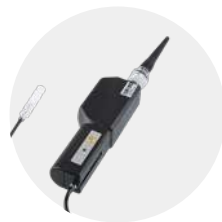
Sonda de muestreo