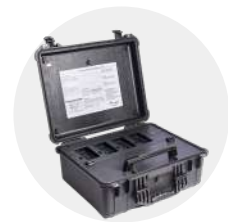
Estación de calibración (Docking station)